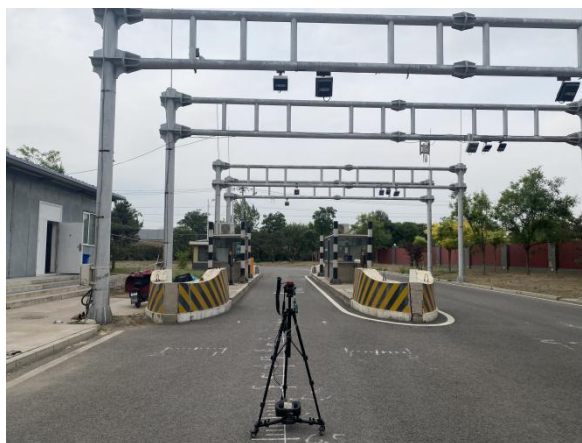
图2 试验场地示意图